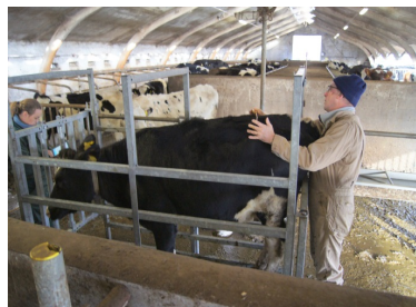
Figur 1.2 Målingerne i FarmTesten viser, at kvierne er betydeligt højere (4-8 cm) end de senest kendte mål.