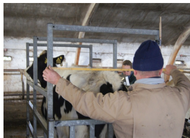
Figur 1.1 Tilvæksten på de højdrægtige kvier i FarmTesten aftager som forventet. Kvierne syntes ikke, at nå 600 kg inden kælvning – selvfølgelig alt afhængig af kælvningsalder.